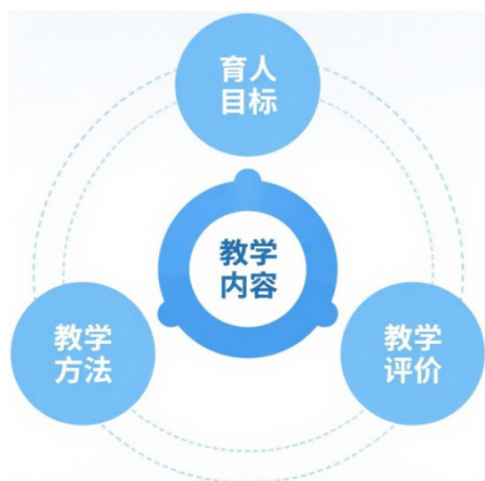
图1 课程思政闭环逻辑设计