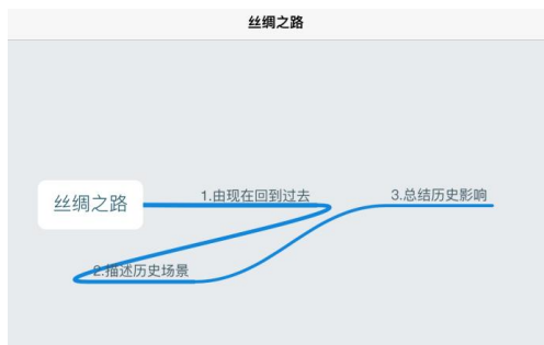
图2 《丝绸之路》脉络图

比如笔者在五年级课文《草原》的教学过程中,按照递进的方式,先考察学生对于字词的理解。然后让学生以树状图的形式对文章进行分段,最后设置一个文段仿写的开放性题目,引导学生经历一遍从阅读到知识运用的过程,激发学生的创新能力。又如笔者在教学中根据《丝绸之路》的写作思路画出脉络(图2),由现在回溯到过去,在倒数第二段总结张骞出使西域开辟丝绸之路以后的深远影响,在最后回到现在进行总结。以思维导图画出文章的写作思路,会呈现出环形闭合式状态,表现出首尾呼应的特点。