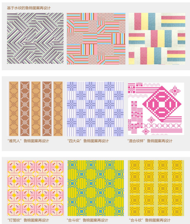
(图三) 再设计的鲁锦图案