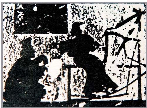
(二) 鲁锦的艺术魅力

鲁锦又称“老粗布”“老土布”“花格子布”,主要分布在鲁西南的济宁和菏泽的周边地区,文化历史底蕴深厚,鲁锦的织造工艺有2000多年的历史,最早对鲁锦的记录可以追溯到春秋战国时期,其中有曾子的母亲织布的记载,嘉祥武氏祠汉画像石刻有一幅《曾母投杼图》(图1),其中曾母使用的斜织机与现在鲁西南家家户户的立式织机的先祖。随着棉花在鲁西南的大量种植,明清之际鲁西南的棉纺织业已经非常繁荣,清代濮州(今山东省鄄城县)的鲁锦曾被用作贡品。