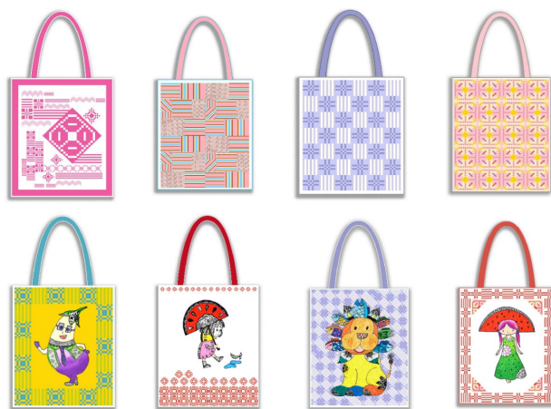
(图五) 鲁锦包包文创产品

设计，设计出种类丰富、品种多、舒适耐用、视觉效果好的包包产品，满足不同消费者的诉求，例如将再次设计的图案与手绘插画结合，采用高清数码技术印刷表面图案，材质仍保留原有的棉质鲁锦，这种类型的鲁锦文创包包视觉效果更前卫。