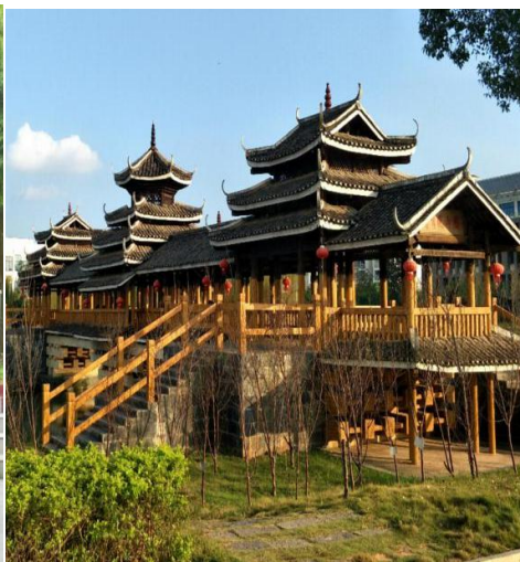
图1-2 南宁学院里的风雨桥