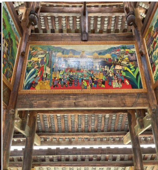
图1-4 风雨桥内的农民画