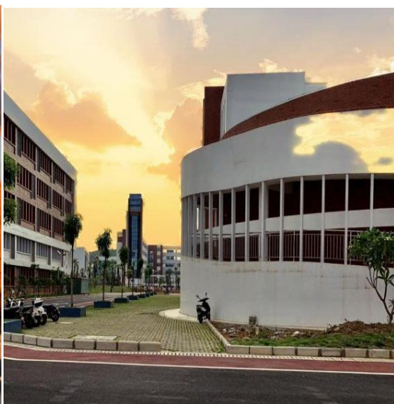
图1-6 富有人文艺术感的校园设计