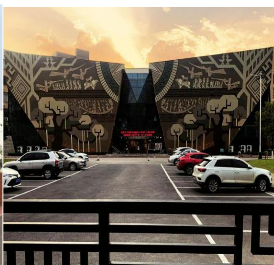
图1-8 广西艺术学院美术馆