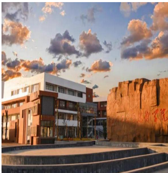
图1-5 协调色校园环境色

除了广西理工职业技术学院的孔子像之外，在南宁学院的校园内也有一座宏伟建筑值得我们去发现，那就是：风雨桥（如图1-2）。风雨桥又称花桥、福桥。此类梁桥流行于南方侗族地区，一般是用石头跟木头共同砌成，以石为墩，跨木为梁，上部为亭廊供人们日常遮风避雨所用，整个建筑都用榫眼打孔，穿梁接拱，立柱连枋，不用一颗钉子，全都用榫眼连接（如图1-3）。风雨桥寄托了侗族祈福消灾的愿望，人们认为风雨桥是“生命之桥”因此每村每寨都得有一座风雨桥以祈福风雨桥吸引更多的生灵，兴旺村寨的人丁。而在南宁学院对这座风雨桥内部天花板部分设计，还专门聘请了三江诸多农民画家来进行画作创作（如图1-4），做到了“画说”侗寨，因此这座桥由外至里都散发着浓浓的民族文化气息，因此在高校校园内设计这座建筑，有几点意义：第一，可以让师生们树立民族文化自信，认识到广西本土民族人民的伟大智慧结晶，有利地让学生们了解广西本土民族文化知识，因为传统文化是一个民族的特色，也是民族的思想观念表达，所以这样可以有效的建立和谐的校园环境；第二，合理的践行社会主义核心价值