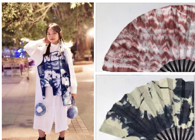
(图2 扎染，扇子获2017广州市文创比赛一等奖) [5]

学以致用才是关键，因而，在将传统文化融入项目教学时，我们通常采用文化调研之传统文化认识——头脑风暴之传统元素提炼——设计制作之构思调整确定——拍摄走秀之作品展示的流程进行教学，指导学生如何进行设计调研、元素提炼、设计构思、产品设计、制作、拍摄、展示等。通过不断实践，学生创作了大量作品。其中校级奖项10多项，市级奖项9项，省级奖项3项（见图1、2、3、4）。