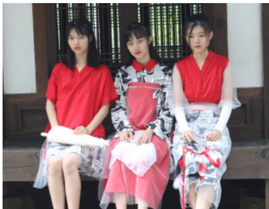
图1 汉服，获校企合作项目一等奖