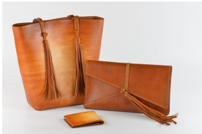
(图3 盘扣，获2018广州市文创比赛二等奖)

知来处，方能明去处。传统文化是我们的优势，需要保护、学习、发扬才能焕发出它应有的生机。然社会在进步，时代在发展，将中国传统文化与现代中职服装专业教学有机融合也需要不断探索和更新。这需要我们教师继续不断提高自身综合素质，在教学中引导学生实践探索，融合创新。将优秀传统文化延续下去的同时，提升学生的综合实力，为以后升学就业打下坚实的基础。