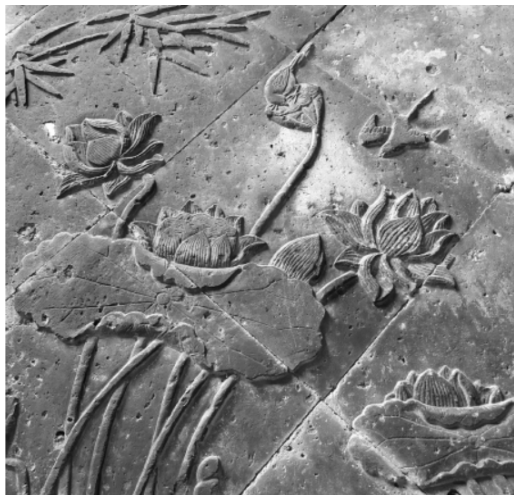
图1 植物与动物砖雕

为了喜上眉梢，把梅花枝分开。伴随着几朵芙蓉花，双燕子穿梭，象征着家庭的安定和谐，这是一种美丽吉祥的寓意。牌子下有两只鸳鸯，表示夫妻和睦，家庭幸福。整个墙面装饰艺术设计简洁、明快、含蓄，线条雕刻生动流畅，加工工业极其精湛，体现了当地人的身份、态度和追求，更好地诠释了中国传统财富观和审美价值。