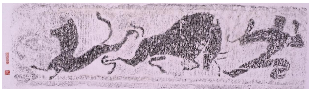
斗牛角抵画像石 东汉(36cm×120cm)