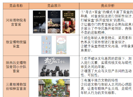
图1市场现存盲盒比较与分析

市场现存博物馆文创盲盒有河南博物院考古盲盒、故宫博物院猫盲盒、陕西历史博物馆青铜小分队盲盒、三星堆博物馆祈福神官盲盒等。这些系列盲盒都抓住了年轻人的审美特点,将盲盒玩法进行创新,打破了盲盒“拆开就结束”的困局,保留了地方文物的特性,在不破坏其内核和基因的前提下,将提炼出的文化元素融入现代年轻化的审美特性,拉近了文物与年轻人之间的心理距离,使其产生精神共鸣。(如图1)