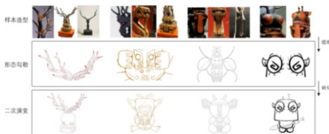
图4镇墓兽盲盒主要特征形态