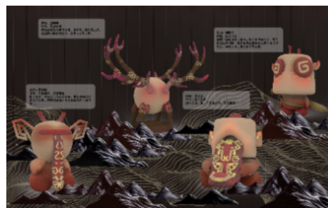
图5楚镇墓兽盲盒形象视觉效果及说明

根据上述分析结果，结合草图演变得到的4个样式，可重点应用于盲盒造型设计中。1. 楚镇墓兽种类丰富，与其他地区的类似文物相比，多采用“c”型、“s”型曲线设计，身体部分较圆润，加上独特的鹿角结构，使得楚镇墓兽整体富有规律，具有独特的美感和神秘感，应用于盲盒设计展现其超现实的意蕴和浪漫色彩，同时有利于弘扬荆楚特色文化。2. 楚镇墓兽以凤纹太阳纹、鹿角、长舌、大眼为标识。在运用此类特点的过程中，设计不仅要取其形，更要传其意，利用其流畅自然。圆滑变通的曲线，塑造楚文化的洒脱飘逸。研究设计采用铁与橡胶的材料作为盲盒的主要材料，追求古拙，以红色、棕色等楚文化常用色彩体现楚镇墓兽历经风雨的厚重感。