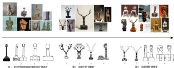
图2春秋战国时期镇墓兽造型演变

时期是楚式镇墓兽的辉煌时期，从出土文物来看镇墓兽大多制作精巧、纹饰精美。这个时期的镇墓兽还出现了兽形头部，面部刻画更加生动，身躯类似龙蛇长而柔软，底座也由之前的斗形变为了梯形。而最大的一个变化则是出现了极为夸张的鹿角造型。战国晚期，晚期的楚式镇墓兽基本上没有了双头兽的痕迹，而人形则更加拟人化，而头上标志性的鹿角，有时也不再出现。（如图2）