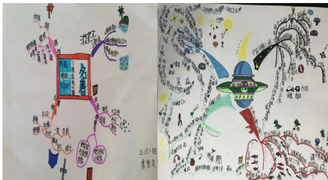
《海底两万里》思维导图