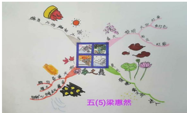
《四季之美》思维导图

1、课前制作思维导图。在学习新课之前,可以先让学生先阅读文本,在了解课文的主要内容,理清文章的写作思路的基础上绘制课文的思维导图,记录预习所得,为课堂的学习做充分准备。比如在学习《四季之美》这篇文章之前,学生根据课后思考练习题进行预习课文,结合自己的理解,理清文章的结构(按春夏秋冬的顺序描写四季景物的特点),抓住关键词语,画出本文的思维导图(见下图)。