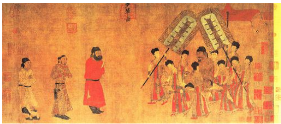
图1 隋唐 阎立本《步辇图》

中国人物画在经过不断的发展中,风格基本都是以写实精神为主要文化特征的中国人物画。中国历代的写实绘画风格也在历朝作品当中有所体现,如隋唐的阎立本,他的绘画风格偏向于写实风格,他的人物造型十分写实、准确、生动,不是死板的描摹对象,而是在细致入微的观察之后再精生动传神的绘画,这很大的不同于初唐的瘦劲人物画风格,要求形神兼备。他的写实代表作有《步辇图》,画面讲述的是文成公主与吐蕃松赞干布联姻的故事,描绘了使者禄东赞拜见唐太宗的场面,画面情节完整人物描绘惟妙惟肖,通过人物的动作衣着环境,正面和侧面的刻画烘托不同的人物形象和精神面貌,将使者的尊敬和虔诚的心情通过弯腰低头的