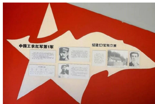
图五 革命历史的图片展示

大别山区面积广阔，各类革命遗址、文物、遗址和遗存在空间和时间上具有分散性的特点，再加上大别山区长期贫困，因此，对整个革命历史时期的各类相关文物征集工作具有很大的难度和长期性。尽管目前各级相关部门加大了对各类图文资料以及红色实物的征集与整理工作，但相对而言，仍然存在介绍较为简单，不够详细与全面，以及展示效果不佳等利因素。整体而言，在对革命遗址的参观体验上缺乏历史厚重感。