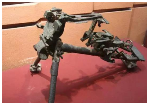
图四 刘邓大军使用过的机枪架

目前，对革命文物与建筑的修复尚处于保证其不因材料自然老化和年久失修以至倒塌灭失的阶段，现有保护方案尚显粗糙，缺乏针对性与科学性；部分石刻、标语在经受了长期的日晒雨淋后，表面已霉迹斑斑、色彩黯淡无光；这与目前更关注宏观结构安全，而对于精细化、科学化保护关注度不够有关。