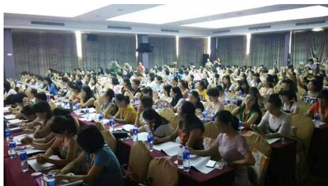
图三 企业员工学习精细化管理知识

管理人员素质对精细化管理的落实具有直接的影响作用，企业需要将精细化管理和绩效管理相结合，创新业绩考核方法，调动管理人员的工作积极性，提升管理人员的综合能力。在现代电子企业中，绩效考核已经成了调动员工工作积极性的关键方法，对于电子企业本身而言，绩效考核、薪酬奖励、岗位晋升等等都会影响到企业的未来发展以及成本管控。因此在实施精细化管理的过程中企业需要认识到绩效管理的重要性，结合绩效管理具体内容融合精细化管理理念，提升绩效管理的有效性 [8] 。一方面，企业需要根据员工的实际能力、岗位性质等，按照精细化管理制度完善考核指标体系内容，并定期对员工进行考核，确保员工完成对应的工作内容。另一方面，企业需要结合绩效考核指标细化员工工作职责，确保二者能够拥有一致性，提升员工工作水平，