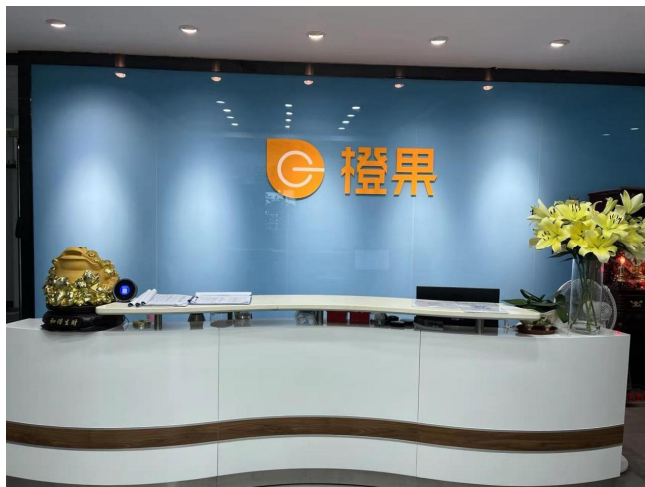
图一深圳市橙果电子有限公司

深圳市橙果电子有限公司于2017年11月02日正式成立, 其主要的经营范围包括电源适配器、手机配件、个人护理保健器材, 数码产品及配件的研发和销售等等, 除此之外, 还包括技术的进出口以及其他一些电子商务等, 图一为深圳市橙果电子有限公司 [1] 。