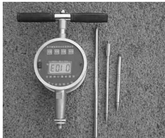
图2 普氏贯入仪设备

测仪器设备采用的是普适贯入仪,主要是通过探头探杆、传感器、显示器、传动轴以及人工操作手柄等部分所构成,适用于各种填土分层碾压填土、分层检验等各项工作,同时也更加适用于抽检底层的土壤质量,其量程为600N,探杆的总长度达到30cm,钻头为30°的锥角直径大小为10mm。