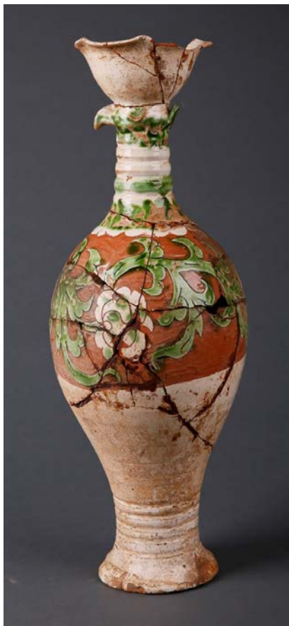
图一 辽代白釉绿彩剔牡丹花叶纹凤首瓶

该藏品(见图一)通高48.4, 最大腹径18, 口径12.1, 底径11, 重约2300克。通体施白釉, 腹部剔地露红陶胎。口部、腹部碎裂残缺。五瓣形花式杯口。口颈之间贴塑凤首, 勾喙, 眼部呈月牙状突出, 凤尾上翘不及杯口, 凤首部分或施或点绿彩使器身显得更加简约大方、生动传神。竹节状细颈, 第三节处施一圈绿彩。颈下部剔划联弧纹, 联弧纹上部施绿彩。圆腹, 腹部剔划牡丹花叶纹, 剔划技法纯熟, 简练粗犷, 遒劲有力, 一气呵成。花分两朵, 其间以叶相连, 叶上施绿彩。花为白色, 间施绿彩。余下部分剔地露出红色陶胎, 这样使得淡雅的白色、清丽的绿色、浓艳的红色这三种色彩巧妙地结合在一起, 交相辉映, 在清新淡雅中又凸显富贵华丽, 可谓匠心独具, 别具一格, 有辽三彩的神韵。腹下近足部饰五圈凹弦纹。圈足, 足内有轮制痕。