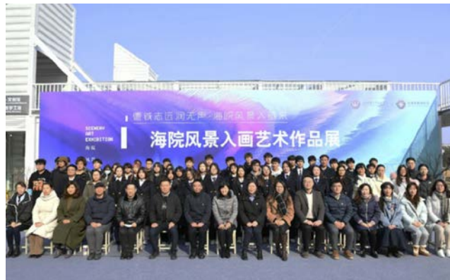
图3 海院风景入画艺术作品展

学生创作能力大幅提升；通过本次项目化改革，学生能积极参与课题活动，均能达到相应的知识、能力和素养，（2）艺术推广能力大幅提升；通过开办艺术作品画展、公众号推广等方式，作品获得了网络关注与点赞达6000多人次。学生不仅收获了知识，还形成了一定的艺术素养，培养了艺术爱好。