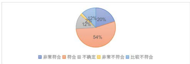
图1 教师教育活动组织

教师的个人心理是由其认知方面、心理方面、态度倾向方面所组成。因此教师的语言态度会直接影响其课程的质量和教学的积极性，本次研究对拉萨市城关区3所幼儿园藏族教师发放49份问卷，据回收调查的数据（图 1）显示，针对教学活动所提出的“在幼儿园教育中，母语教育同国家通用语言教育的安排是均衡的”这项问题我们在与幼儿教师的交流发现，在幼儿园中很少展开针对幼儿的母语教育，在课堂上也主要采用的是以普通话为主进行教学活动的展开。就此看来，在民族传统语言的教育领域方面，各幼儿园存在一定的缺失。缺少民族语言教育，难以为幼儿树立本正确的本民族的文化观念，不利于儿童增进对本民族文化的认同感。