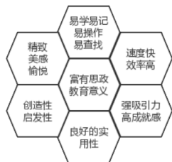
图1 “内容-体验六边形模型”

当代高校学生从小接触互联网，对于互联网内容以及体验有着较高的要求，在当前时代，“互联网+思政教育”是思政育人的主要发展方向，想要取得良好的效果，能够尽量接近或超出学生预期设想是重中之重。参照并分析目前主流互联网平台特点，本文建立了“内容-体验六边形模型”如图1，在以富有思政教育意义为核心的前提下，内容方面应做到：吸引力强、完成学习成就感高、具有创造性和启发性、能够对于实际有较大帮助；同时在学习体验方面应做到：易学、易操作、易查找、访问速度快，学习效率高、网络学习环境精致且富有美感，整体学习过程令人情绪愉悦。