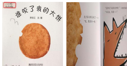
图2 《谁咬了我的大饼》节选图

该绘本中童真的语言、问答式的对话结构，充分满足了小班幼儿的好奇心，采用亲子合作的方式效果会更好。这个绘本可以变成一个简单的亲子表演，以问答的形式展开，在表演过程中，幼儿能够更好、更深入地理解故事内容，并且亲子之情也可以得到升华。