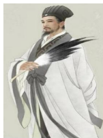
( ) 的诸葛亮

一本书往往会出许多人物，且人物关系复杂。所以，分析人物形象是交流课上常见的内容。五下《三国演义》的交流课上，一位老师出示的“阅读单”是这样写的：诸葛亮在三国众多英雄人物中，称得上是一位忠臣智者，他不仅是优秀的政治家、军事家，还是一位杰出的文学家。你最佩服他的哪一方面？选择一样，从文中找出具体的事例，给诸葛亮设计一张形象名片吧。