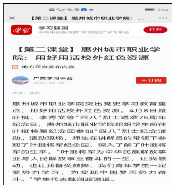
图3 学习强国有关报道

落实立德树人根本任务不能仅仅停留在理论层面，更重要是学以致用。通过丰富的课外实践活动，使得学生在体验学习、理论学习及课外实践中，通过亲身实践和有效参与提升了综合能力，更加坚定了理想信念。学生在接收了理论知识后，如果将所学理论用好、用对才是思政课育人效果的重要体现。通过“党史+4T”教学模式的有效运用，学生不仅学到了深刻的理论知识，更重要的是锻炼了自己的理论宣讲、理论阐释等能力，不仅提升了自己服务同学、服务社会的能力，更进一步坚定了自己的理想信念。