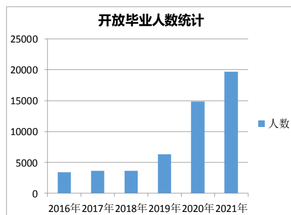
图1 历年来毕业人数统计

2013年江苏开放大学当年挂牌当年招生,经过8年的奋斗与发展,由刚开始的两千多在籍生,发展到如今的十四万多在籍生,毕业人数也在逐年递增,具体人数如图1所示。这一方面说明开放大学的办学得到社会认可,社会影响力也在逐步提升,但另一方面毫无疑问也给管理带来了一些难点。特别从学籍管理角度而言,开放学生和普通学生没有任何区别,同样受限于教育部学信网的毕业要求和办理流程,丝毫不打折扣。配备的管理人员只在近年来增加一位。