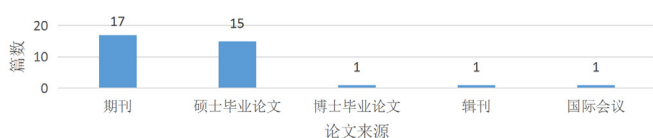
图2 国内以语料库为研究路径的儿童文学翻译研究(2009年-2021年)论文来源