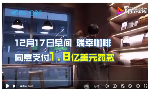
图1 瑞幸咖啡处罚报道

成本报表是按照企业成本管理的需要, 根据产品成本和期间费用的核算资料以及其他有关资料编制的, 对企业进行决策、管理和监督有着重要作用。会计人员应在遵循国家法律法规的前提下, 充分发挥专业技能, 敏锐捕捉控制企业成本的方式方法, 帮助企业经营决策。通过向学生分享瑞幸咖啡的财务舞弊事件视频, 导入本案例内容, 激发学生对成本报表的兴趣, 调动学生的学习热情, 引发学生的思考, 同时增强学生的法规意识和诚信意识。