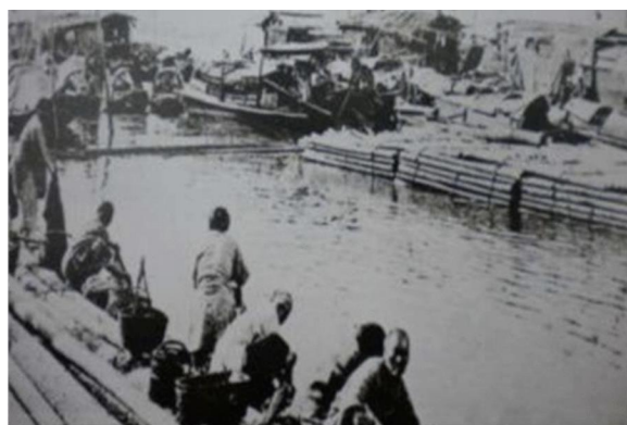
图1 孝感市老澧河历史风貌

有句老话形容孝感“一河两岸八埠口,两块麻糖一杯酒”,这一河便是作为孝感市的“母亲河”的老澧河,老澧河全长8.6公里,承东启西、贯穿南北,水岸潭湾、山水田林湖要素俱全,是连接新老城区的纽带,承载的是孝感市城市的历史与记忆。(图1)