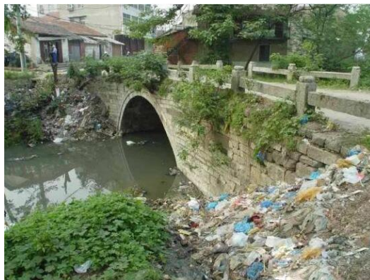
图2 被垃圾淹没的西湖桥

老澧河沿线区域及周边作为孝感历史文化古迹最密集的区域,文化底蕴深厚,历史以来有许多孝感古迹,但大部分都已经消亡或正在消亡中。现如今,老船厂破败不堪、摇摇欲坠;城隍潭桥、西湖酒馆、文昌阁都已不复存在;老麻糖厂、西湖桥(图2)也没有得到很好地保护,随时有可能消散在历史的长河之中。