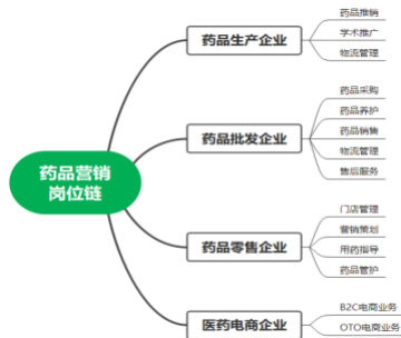
图1 药品营销岗位链

冰冻三尺非一日之寒，在医药供给侧改革的大环境下，人才培养体系的构建需要学校与医药企业双方密切配合，确保学校的人才供给输出与企业所需相适应。根据高等职业学校药品经营与管理专业教学标准和药品购销职业技能等级标准，专业积极拓展与区域内龙头企业、特色企业合作，与四川高济海棠药堂连锁有限公司共建校内生产性实训基地——海棠药堂；与四川泉源堂零售有限公司、四川竹林药业有限公司、四川九州通药业等医药批发企业形成了稳定的人才供给关系，积极探索“订单班”培养路径。根据专业发展的分支，将所有专业能胜任的药品营销岗位链进行整理归纳，以思维导图的方式进行呈现，为院校向企业输送人才的方向渠道奠定基础，如图1所示。