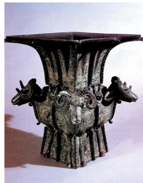
图5，四羊方尊，商代，青铜

青铜雕塑纹饰分为地纹与主纹，其地纹纹饰线条细密以突出主纹纹饰粗壮与庄重。结合青铜雕塑的主要造型，地纹以静、主纹以动形成整体粗狂与灵动的对比。地纹多以阴刻为主，而主纹纹饰多以阳铸为主，圆中有方，方中有圆，形成整体造型下直曲、前后的空间错落之感。