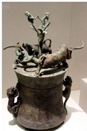
图2 虎耳细腰圆筒型贮贝器,西汉,青铜

1969年于甘肃省武威市雷台墓出土的“马踏飞燕”(图1),是东汉时期青铜艺术的杰出代表,堪称中国古代运用现实主义与浪漫主义手法相结合的艺术典范。一匹体态健美,疾驰飞奔的千里马,张口嘶鸣,三足腾空,右后蹄下踏着一只展翅而过的飞鸟。其构思巧妙,造型生动,以飞鸟的疾速来衬托奔马的神速,又将奔马的不羁之势与平稳的力学结构而巧妙地结合在一起。通过写实的动物姿态传达社会生活的豪迈、活力与浪漫,反射艺术审美思维下的蓬勃的生命力和一往无前的气势。