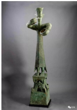
图4 三星堆青铜立人像，西汉，青铜

1. 宗教信仰与图腾崇拜。中国传统雕塑艺术中的青铜艺术具有异乎寻常的艺术想象力和艺术表现手法。三星堆青铜造型艺术在古文化遗址中独树一帜，具有鲜明的宗教信仰与图腾崇拜色彩。三星堆共出土青铜人头像共54件，注重整体共性中的个性意识的塑造，通过大型群雕的体量与规模塑造庄严肃穆的氛围。