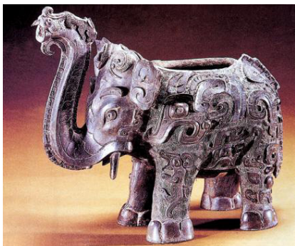
图3 象尊，商，青铜

三千多年前，我国工奴奴隶的手工制作了一件精美的雕塑艺术珍品，解放后出于醴陵的象尊（图3），高23厘米，由于商代的奴隶主对酒特别的嗜好，所以对酒器的美观和功能的要求也高，通过这件象尊可以看到设计的匠心独运，在造型上把大象的鼻子的弧线优美，高出背部不仅符合大象的生理特征也防止尊中酒满溢出，不仅符合功能性也结合了美观。大象的额头、鼻端、背上雕有小鸟作为配饰使他显得生动可爱。以云雷纹作地的雷纹、饕餮纹浮雕体现了商代的时代性艺术特征。