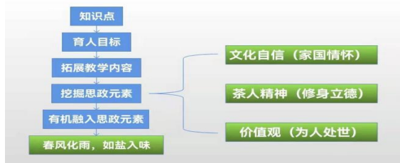
图6 知识点与思政元素融合路径

分析,以“由浅及深、知行合一”为原则,由一个“知识-思政点”,发展到多个,最后形成一条“思政线”,有多条“思政线”形成一个“思政面”,将思政元素与专业理论知识融为一体。充分利用网络平台资源、运用混合式教学模式和任务驱动教学,在课前、课中、课后贯彻“全过程育人”理念。