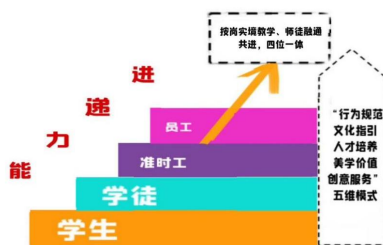
图8 “四位一体”递进式人才培养理念