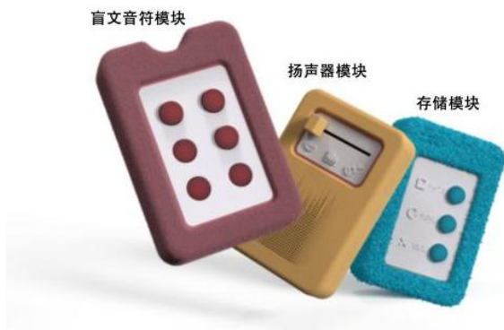
图1 视障儿童音乐类交互玩具设计

具体来说：（1）盲文音符模块的主体为六个按钮，布局和已有的盲文盲谱的文字或音符的表示方式一致，视障儿童通过按钮压下和弹起的状态输入不同的盲文音符。（2）扬声器模块提供三种不同的声音：人声、钢琴、吉他，帮助视障儿童更好的认知音乐。（3）存储模块有在原基础上添加音乐片段、更新音乐片段和删除三种功能，通过按钮实现。