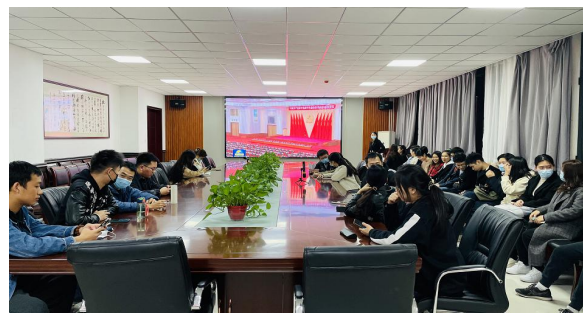
图2 研究生思想政治教育活动

研究生辅导员在利用新媒体开展思想政治工作的过程中,需全面把握信息时代的发展规律。在新媒体技术与研究生思想政治教育手段的融合中,充分发挥新媒体在教育资源可视化和呈现方式多元化的优势,使研究生思政工作的改革更加贴合时代发展的脉搏。依托高校信息资源,加强对新时期研究生思想政治教育的规律性和新颖性的研讨,提升海量教育资源信息的运用,全面适应新时期人才培养的要求。并在这一进程中,围绕新信息时代环境下思想教育、价值实践及生活互动三个维度,构架具有院校特色的思想政治平台资源数据库,为研究生思政工作的有力开展夯实素材基础。